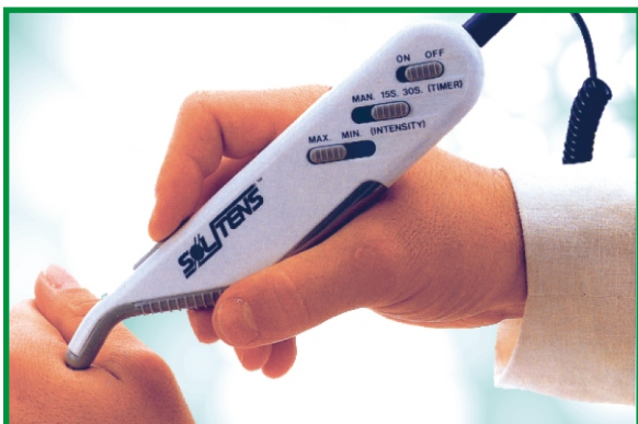
Mod. SW -103C